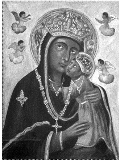
Il quadro della Madonna di Romania custodito nella chiesa di San Giovanni

donata ai monaci di Montevergine, facendola collocare nella cappella gentilizia dei d'Angiò. Per dirimere dubbi e perplessità sulla sacra immagine, il Concilio ecumenico vaticano (1962-1965) affidò ad alcuni critici e storici dell'arte, il compito di stabilirne l'origine. I risultati di tale indagine furono univoci e concordanti: la paternità del quadro venne assegnata alla scuola di Pietro Cavallini. Innanzi tutto per la presenza di alcuni elementi stilistici distintivi della sua tecnica pittorica, come l'intonazione bizantina e il tipico modo di panneggiare; in secondo luogo per l'acclarata sua attività alla corte degli Angiò. La presenza dei gigli angioini intorno all'immagine della Vergine, ne legano indiscutibilmente l'origine pittorica a quella casa regnante. Nel corso dei secoli la sacra immagine assunse il titolo definitivo di "Madonna di Montevergine". La tela, nel tempo, ha subito sensibili modifiche. Sono stati aggiunti alcuni particolari degni di nota come le corone poste sul capo della Madonna e del Bambino ad opera di famosi maestri orafi di Napoli. Nel 1960, per fare fronte all'enorme flusso di pellegrini, fu realizzata una nuova basilica e la tela venne così ubicata sul grandioso trono dell'altare maggiore.