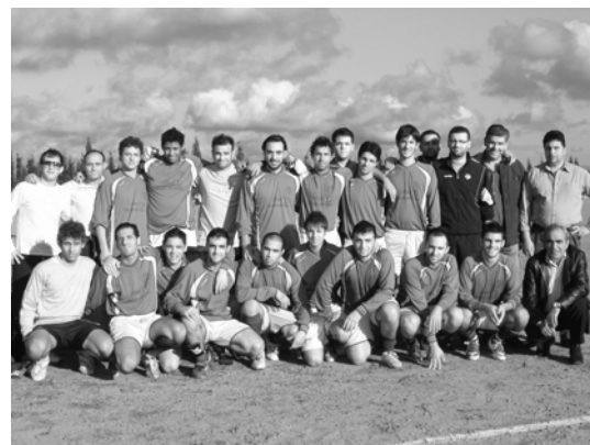
Squadra di calcio “Costa degli dei” 2008-2009