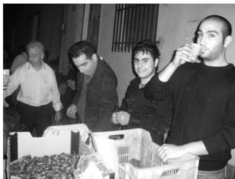
La preparazione delle caldarroste