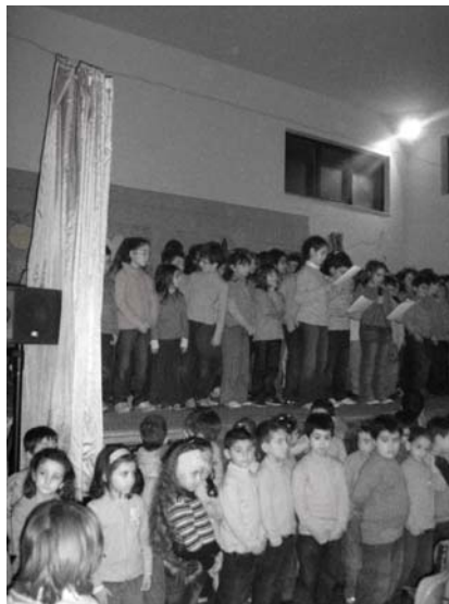
Un momento della recita natalizia

Il corpo docente, il personale non docente e le famiglie degli allievi hanno definito il quadro delle collaborazioni necessario alla perfetta riuscita della manifestazione. Le scene teatrali, liberamente ispirate al Vangelo, hanno rappresentato la nascita di Gesù e gli eventi precedenti ad essa. Le scenografie sono state realizzate dagli alunni nelle passate settimane. Le musiche, suggestive e appropriate e l'eleganza dei costumi hanno destato fra gli astanti unanimi consensi. Nell'ambito delle manifestazioni natalizie, la scuola dell'infanzia e la scuola primaria di Zambrone hanno promosso una sottoscrizione volontaria il cui ricavato sarà devoluto all'Unicef.