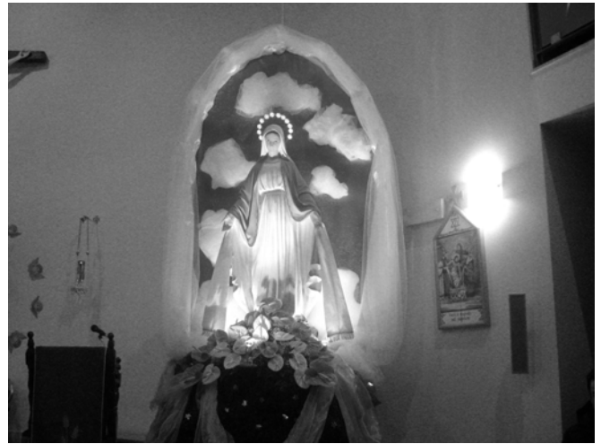
La statua della Madonna Immacolata custodita nella chiesa Santa Marina Vergine di San Giovanni