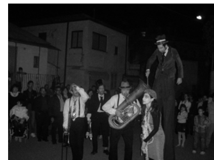
Lo spettacolo "Musiclown"