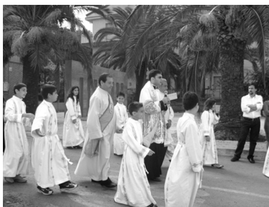
Un momento della processione