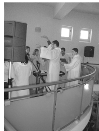
Il coro di Soriano "Dominicus" durante la santa messa